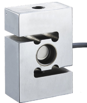
Zug-/Druckkraftaufnehmer, Typ F2802