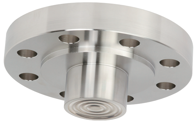
Separatory membranowe z przyłączem kołnierzowym model 990.48